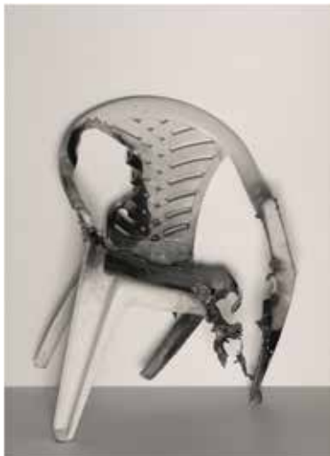
Ivan Pinkava | Židle | Chair | 2020

Galéria mesta Bratislavy Pálffyho palác Panská 19, Bratislava