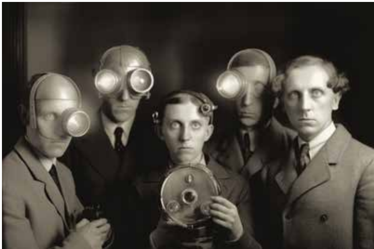
Difuzionisti | Diffusionists | 2023

Stredoeurópsky dom fotografie, Galéria Martina Martinčeka Prepoštská 4, Bratislava