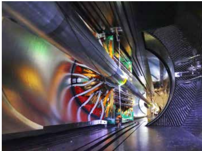
Súčasný tunel Veľkého hadrónového urýchlovača s obvodom 27 kilometrov | The current Large Hadron Collider tunnel, 27 kilometres