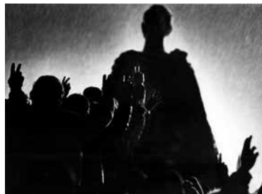
Ján Lörincz: Demonštrácie, Námestie SNP | Demonstrations, SNP Square | 1989

PREDNÁŠKA SPOJENÁ S DISKUSIOU A VÝSTAVOU FOTOGRAFÍ PRI PRÍLEŽITOSTI 35. VÝROČIA NEŽNEJ REVOLÚCIE | A LECTURE, FOLLOWED BY A DISCUSSION AND PHOTO EXHIBITION IN COMMEMORATION OF THE 35 TH ANNIVERSARY OF THE VELVET REVOLUTION