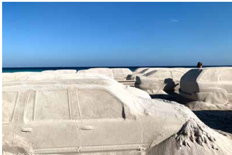
Miami Beach | 2019