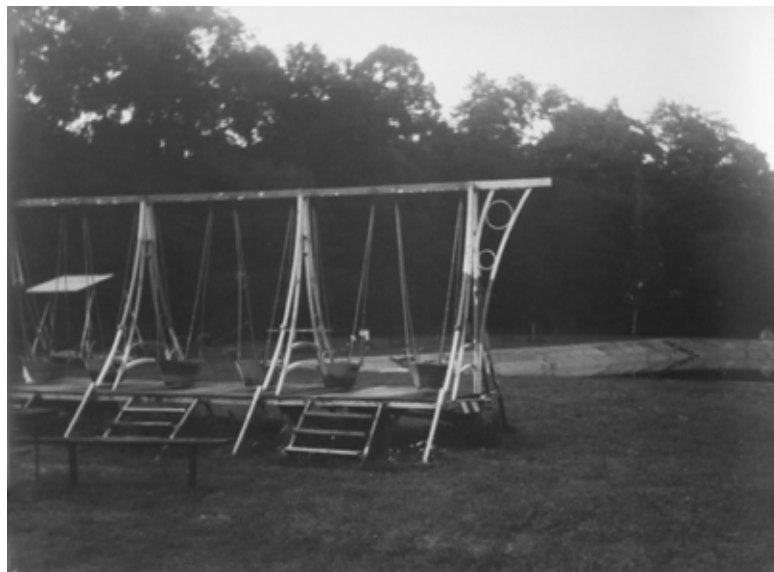
Bez názvu | Untitled, z projektu Pán Uhorka a slečna Mandelinka | from the project Mr. Cucumber and Miss Potato Beetle | 2008

Staromestské centrum kultúry a vzdelávania Pistoriho palác Štefánikova 25, Bratislava