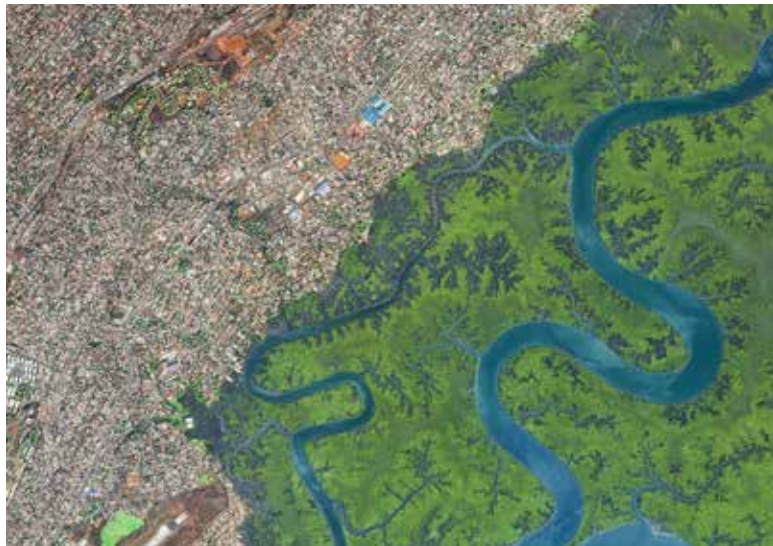
Ludská stopa | The Human Footprint

Galéria Slovenskej výtvarnej únie - Umelka Dostojevského rad 2, Bratislava