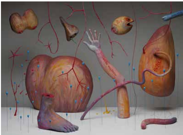
Moja lekcia anatómie | My Anatomy Lesson | 2022

Polský inštitút Námestie SNP 27, Bratislava