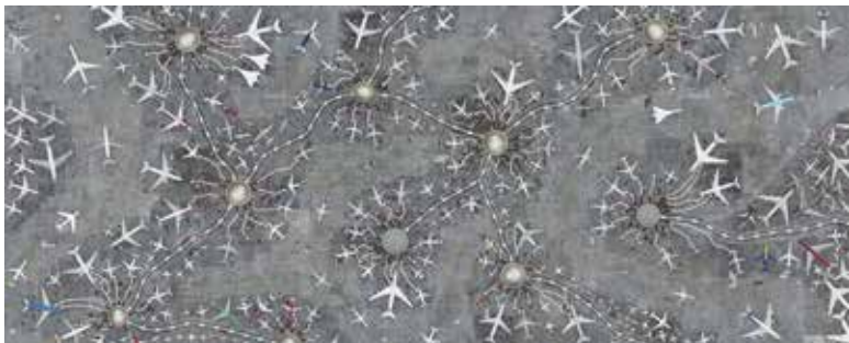
Letisko | Airport

Galéria Slovenskej výtvarnej únie - Umelka Dostojevského rad 2, Bratislava