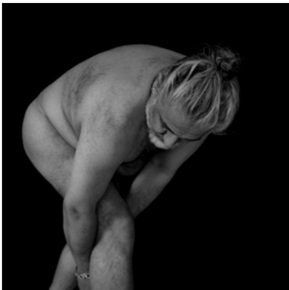
Očista mojich nôh – Jemná rovnováha | Cleansing My Feet – A Fine Balance Max Kandhola © assisted by Oliveer Preisler-Kandhola | 2022 – 2024

Galéria na 1. poschodí Zichyho palác Ventúrska 9, Bratislava