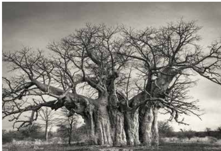
Bufflesdriftský baobab, Južná Afrika | Bufflesdrift Baobab, South Africa

Galéria Slovenskej výtvarnej únie - Umelka Dostojevského rad 2, Bratislava