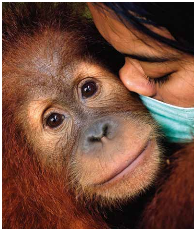
Alain Schroeder | zo série Záchrana orangutanov | from the series Saving Orangutans | 2020