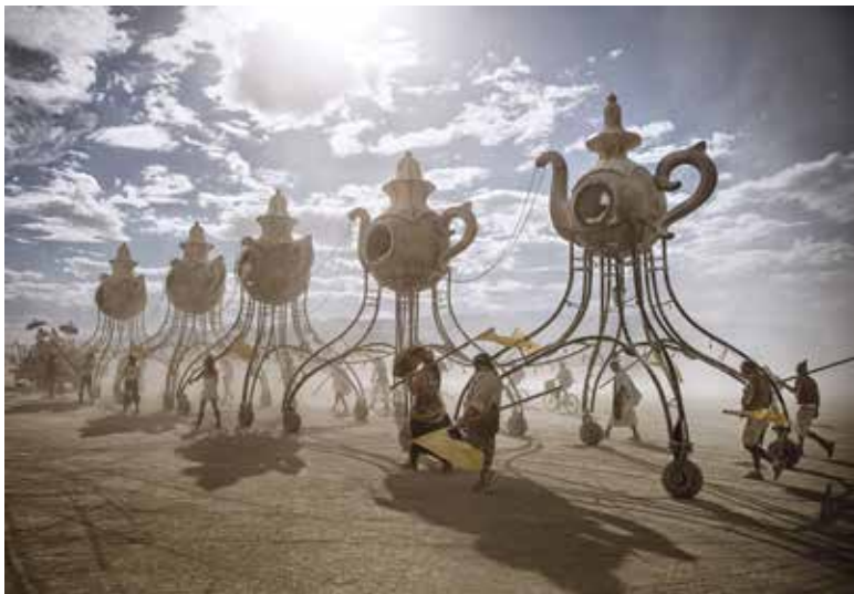
Pred súmrakom | Before Dusk | z cyklu | from the series Burning Man | 2016

Výstavná sála Univerzitnej knižnice v Bratislave Michalská 1, Bratislava