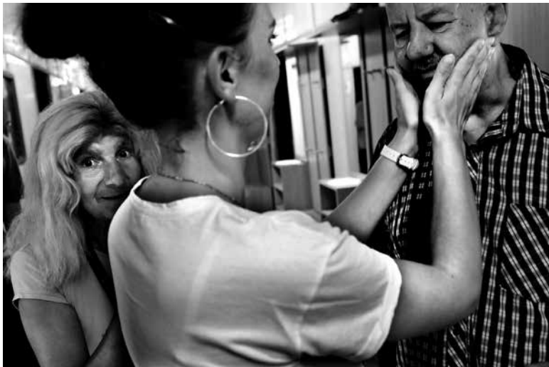
Bez názvu | Untitled | z cyklu Vzdialená blízkosť | from the series Distant Proximity | 2021

Stredoeurópsky dom fotografie Galéria Profil | 2. poschodie | 2nd floor Prepoštská 4, Bratislava