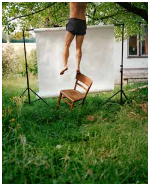
Bez názvu | Untitled, z cyklu Teraz nie je ten správny čas | from the series Now Is Not the Right Time | 2023

Rakúske kultúrne fórum Astoria Palace Hodžovo námestie 1/A, Bratislava