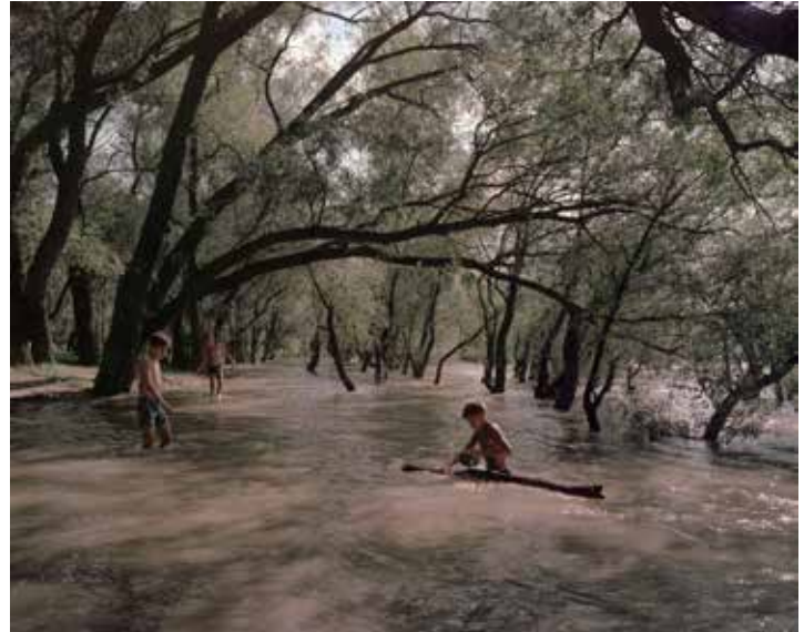
Povodeň na Dunaji. Deti hrajúce sa v lužnom lese | Flooding at the Danube. Children playing at the floodplain forest | 2023

Inštitút Liszta Maďarské kultúrne centrum Bratislava Štefánikova 1, Bratislava