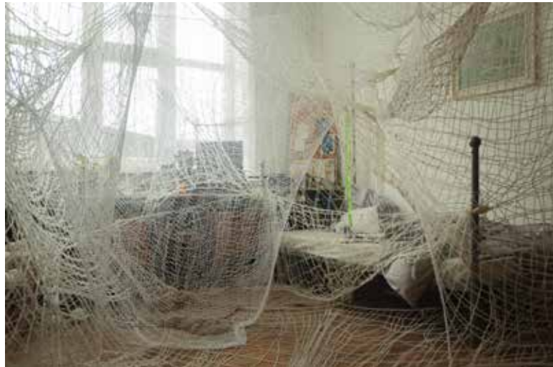
Terézia Ďurišová | Výplet | Nets | 2024