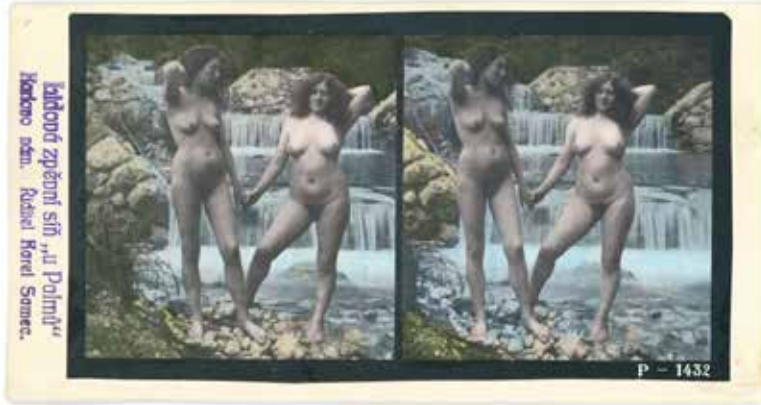
Anonym (Nemecko) | Anonymous (Germany) | Akty pri vodopáde, ručne kolorovaná tlačaná stereofotografie | Nudes at the Waterfall, hand-coloured printed stereo photograph, okolo roku 1905 | around 1905

Múzeum fotografie Prepoštská 4, Bratislava