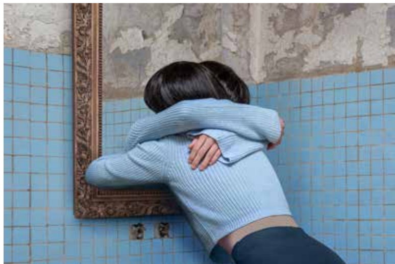
Pozri sa do zrkadla a povedz milujem ťa | Look in the Mirror and Say I Love You | 2023

Slovenský inštitút v Berlíne Hildebrandstr. 25, 10785 Berlín, Nemecko