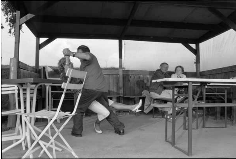
Bez názvu | Untitled | okolo r. 1993 | around 1993

Galéria Artotéka Mestská knižnica v Bratislave Kapucínska 1, Bratislava