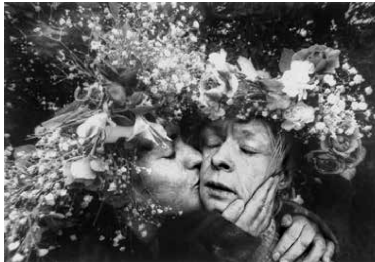
Svätojánska noc | Midsummer Eve | 1995

Stredoeurópsky dom fotografie Galéria Profil | 2. poschodie | 2nd floor Prepoštská 4, Bratislava