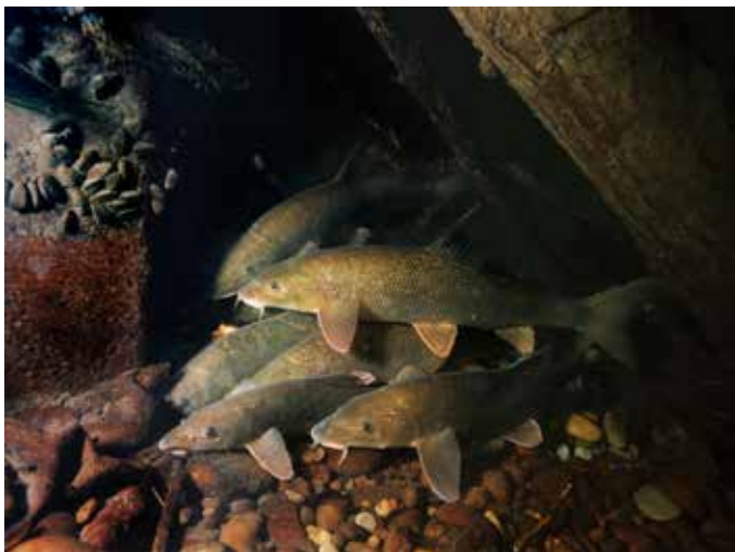
Zimujúce mreny | Wintering Barbels | 2014 (Mrena severná je typická dunajská ryba. Je veľmi citlivá na znečistenie životného prostredia. | Common barbel is a typical Danube fish. It is very sensitive to environmental pollution.)

Plot | Fence | Outdoor Galéria Slovenskej výtvarnej únie – Umelka Dostojevského rad 2, Bratislava