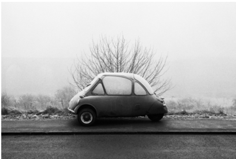
Elland | z cyklu Zlé počasie | from the series Bad Weather | 1978

Dom umenia, Národné osvetové centrum 2. poschodie | 2nd floor Námestie SNP 12, Bratislava