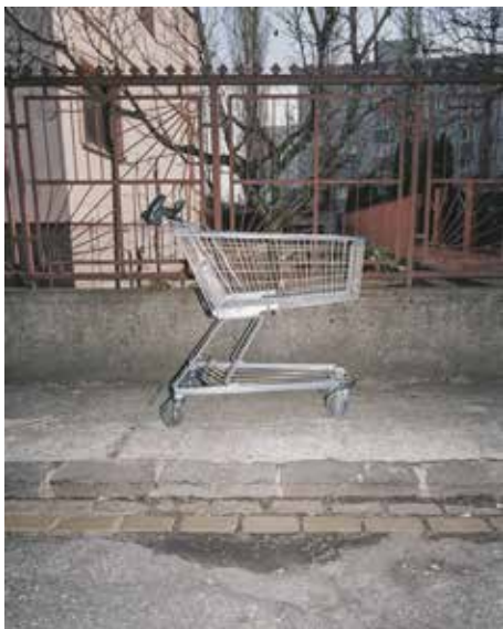
Z projektu Lonely Planet Trnávka | From the Project Lonely Planet Trnávka | 2021 – 2024

Slovenský inštitút vo Viedni Wipplingerstrasse 24 – 26, 1010, Viedeň Rakúsko