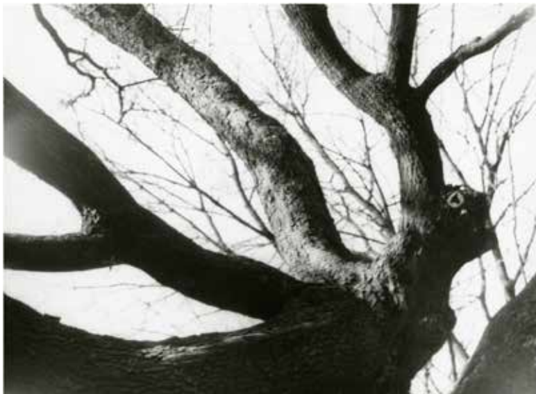
Dub pravták | Ancient Oak Bird

Slovenský inštitút v Budapešti Rákóczi út. 15, H - 1088, Budapešť VIII. Maďarsko