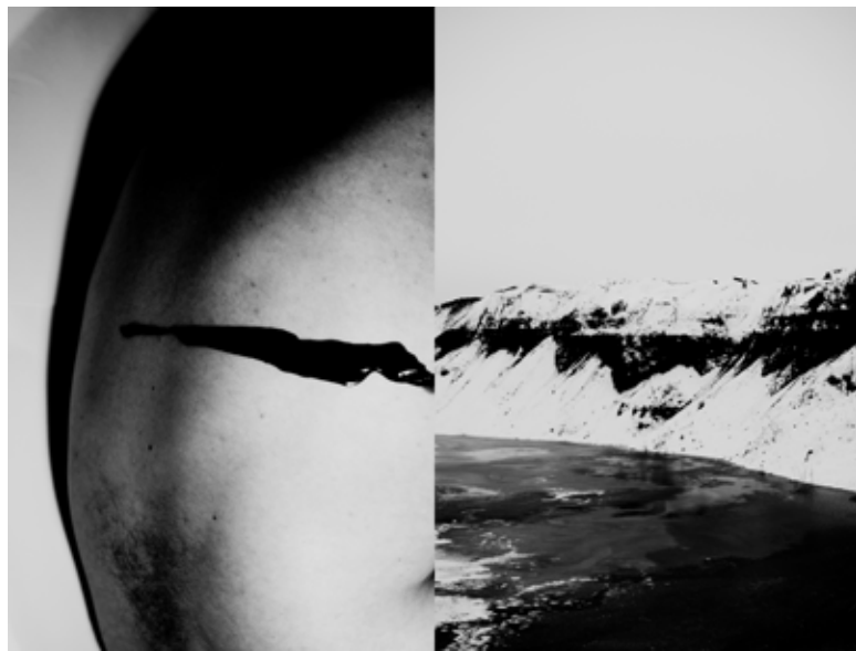
Zo série Rieka | from the series River | 2021

Galéria F7 Františkánske námestie 7, Bratislava