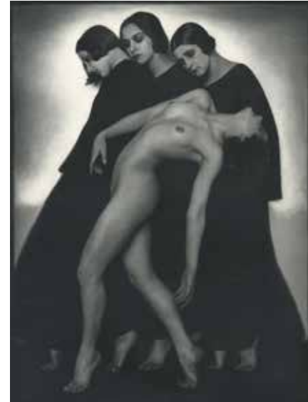
Pohybová štúdia | Movement Study

Dom umenia, Národné osvetové centrum 2. poschodie | 2nd floor Námestie SNP 12, Bratislava