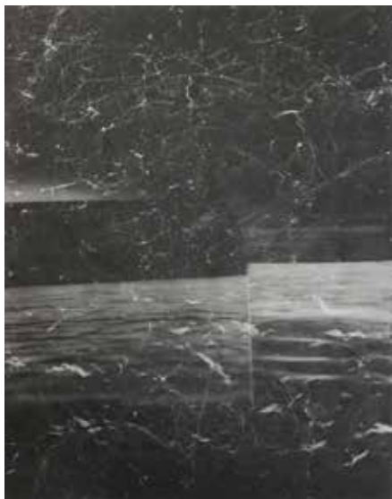
Bez názvu | Untitled | 2024

Dočasný kultúrny priestor Rovniankova 5, Bratislava